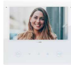
Videogegensprechanlage Vimar ELVOX „TAB7SUP“