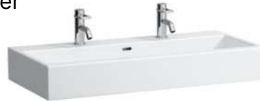
Waschtisch Laufen Living City, weiß, B60/80/100 cm x T46 cm