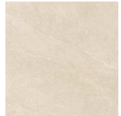
Fliesen in Monterey