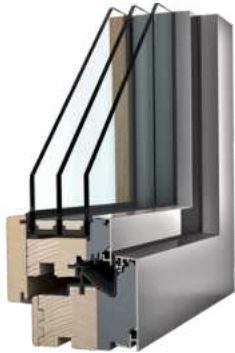
Dreifach verglaste Holz-Alu Fenster