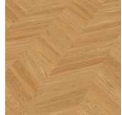
Fischgrätsparkett, verlegt nach französischer Art, in Eiche