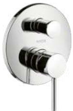
Wannenmischer AXOR, Starck