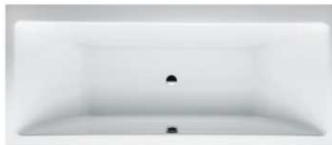
Badewanne Laufen, Pro, weiß, B80 cm x L180 cm