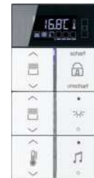
Jung LS 990 KNX Kompakt-Raumcontroller F 40