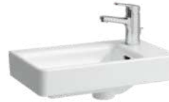
Handwaschbecken Laufen, Pro S, 48/28