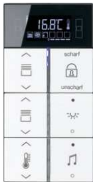
LS 990 | KNX Kompakt- Raumcontroller F 40