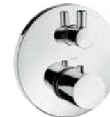
Brausethermostat AXOR, Uno