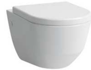
Flachspüler Laufen, Pro