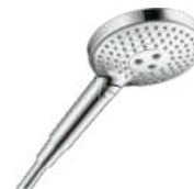
Handbrause AXOR, S120, 3 jet